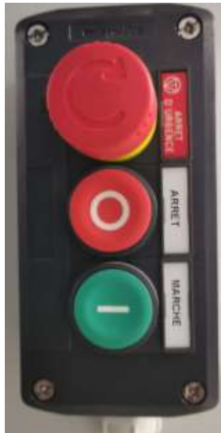
Boutons de mise en œuvre de la ventilation

NB : les boutons d'arrêt d'urgence (« coup de poing ») doivent être employés EXCLUSIVEMENT en cas d'URGENCE et non pour un arrêt normal.