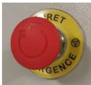
Bouton d'arrêt d'urgence principal

Il est absolument interdit d'utiliser le sectionneur situé sur le côté droit-haut de l'armoire de ventilation ; la mise en route et le stoppage se font uniquement avec les boutons correspondants situés sur le côté gauche de l'armoire. Noter que le démarrage et l'arrêt des moteurs sont programmés avec des périodes de montée et descente en puissance.